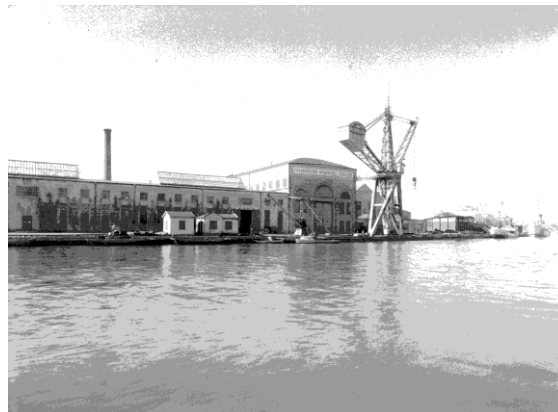
Fredrikstad Mekaniske Verksted og andre industribedrifter trakk mange Hvalrær til byen

Årene etter krigens slutt er preget av fremtidshåp og optimisme i det norske samfunnet. I Nedre-Glomma-området går det mot slutten for tradisjonell industri som trelast og produksjon av teglstein mens allerede etablerte bedrifter som Fredrikstad Mekaniske Verksted (FMV), De-No-Fa, Titan og Borregaard bygges videre ut og bringer vekst også til en rekke underleverandører, samtidig som ny industri vokser fram. Denne industrielle veksten og boligutvikling med lettstelte leiligheter bl.a. knyttet til nevnte hjørnestensbedrifter (Paul Holmsens vei og Kongsten) trekker folk til fastlandet. Nedgangen i befolkningstallet på Hvaler som startet før krigsutbruddet, skyter nå ytterligere fart. Ved folketellingen i 1946 bodde det 3470 personer på Hvaler, en nedgang på over 700 fra 1910.