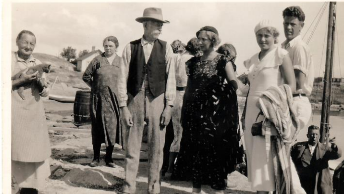
Med respekt og en viss undring blir badegjestene ønsket velkommen til Vikersund på 1930-tallet

av hovedhuset for å skaffe seg en ekstra inntekt i sommer-månedene. Denne sesongvise tilstrømningen ga kjærkomne inntekter både for privatpersoner, fiskere og de som drev butikk. I tillegg utgjorde sommergjestene spennende innslag både i form av annerledes klær, omgangsformer og dialekt. Sommergjestenes "hjelpeløshet" i båten, "forfinet språk" og, fra noen, det som ble oppfattet som arrogant væremåte ga ikke minst grunnlag for gode historier og myter om "badegjesten": "har du hørt at.....?"