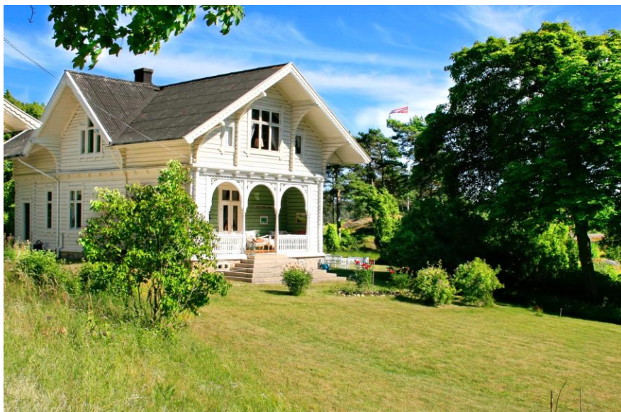
Dahllsberg-villaen på Nordre- Sandøy, en av Hvalers aller første hytter

Rundt byene Fredrikstad, Sarpsborg og Halden er det også veksttid på slutten av 1800-tallet. En stor arbeiderklasse vokser fram knyttet til teglverk, trelastbrukene og flere skipsverft. Dette gir også grunnlag for et borgerskap som ikke bare flottes seg med prangende boliger i byene. "Fredrikstad-borgerskapet" etablerer landsteder på Hankø og i nærliggende områder, mens "Halden-borgerskapet", vokst fram gjennom industrireisning og militært lederskap, orienterer seg mot de østre øyene og Skjærhalden på Hvaler.