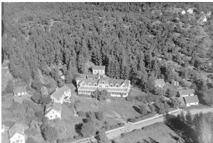
Skjærhalden badhotell fotografert på 50-tallet

Selv om utviklingen på Hvaler i første halvdel av 1900-tallet ga innslag av turisme knyttet til hoteller og pensjonater, noe hyttebygging og privat innlosjering, gikk livet sin vante gang.