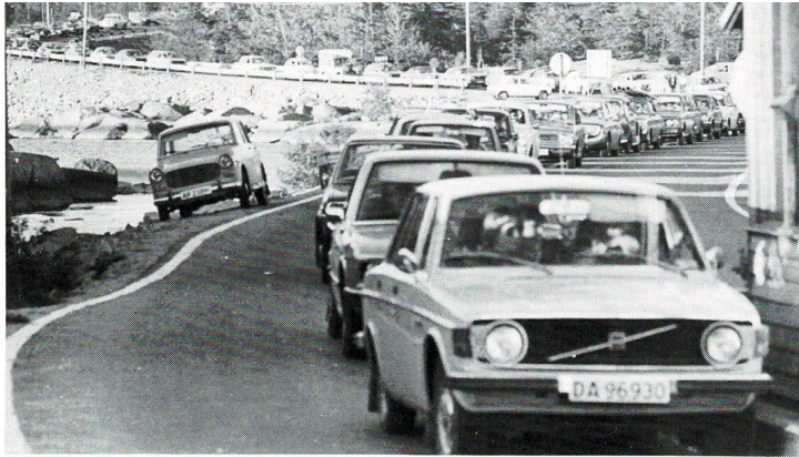
Biler i kø ved bommen i 1971

Etter andre verdenskrig valgte myndighetene å innføre kvoteordninger på bilimporten. Titusener stod i kø for å få kjøpetillatelse, bare en brøkdel av søkerne fikk. I perioden fra 1950 fram til rasjoneringen ble opphevet i 1960, økte tallet på personbiler med rundt 200.000. I 1966 passerte antallet personbiler 1 million i Norge. Dette var således en eksplosjonsartet økning og gjorde bilen til allemannseie med de utfordringer dette førte med seg både i forhold til veisystemet og transportnettverket for øvrig (kilde: SSB)