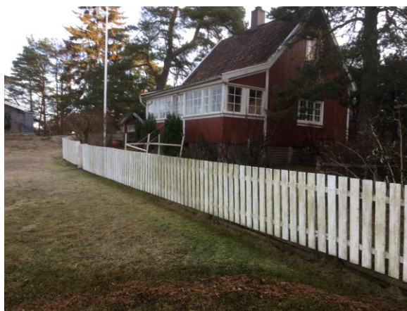
"Kråkerøy-hytte" fra 1920-tallet her på Spjærøy ved Skjelsbusundet

Ut over på 20- og 30-tallet bygges det hytter også på andre deler av Hvaler, ikke i samme fasjonable form og størrelse som de første på østre Hvaler, men like fullt av en langt høyere standard enn de mindre "kasse-hyttene", ofte med pulttak, som ble satt opp noen ti-år senere. Nå var det det funksjonærer og ledere både i næringsliv og det offentlige som etablerte seg med hytter også på de vestre øyene. Typiske for denne perioden er de såkalte "Kråkerøy-hyttene", med glassveranda og saltak (bildet under). En rekke av disse finner vi fortsatt bl.a. på Spjærøy, i Ødegårdskilen på Vesterøy og Siljeholmen.