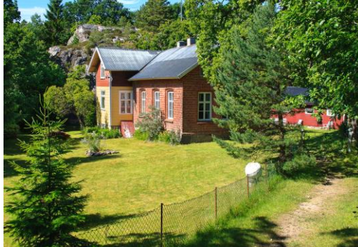
Den gamle skolen på Nordre Sandøy er en av mange skolebygg som er tatt vel hånd om og omgjort til fritidsbolig

Ut over på 50- og 60-tallet sank befolkningstallet år for år og nådde et bunn-nivå rundt 1970 med drøyt 2200 bosatte i kommunen. Størst var nedgangen i folketallet på de østre øyene. Denne nedgangen førte igjen til at en rekke hus, offentlige bygg og mindre gårdsbruk på Hvaler ble solgt, mange av disse til ferieformål. Hvor mange eiendommer som ble overdratt til slektninger og andre som ferieboliger, er det imidlertid vanskelig å anslå, men med en nedgang i folketallet på rundt 1300 fra 1946 til 1970 snakker vi om et betydelig antall.