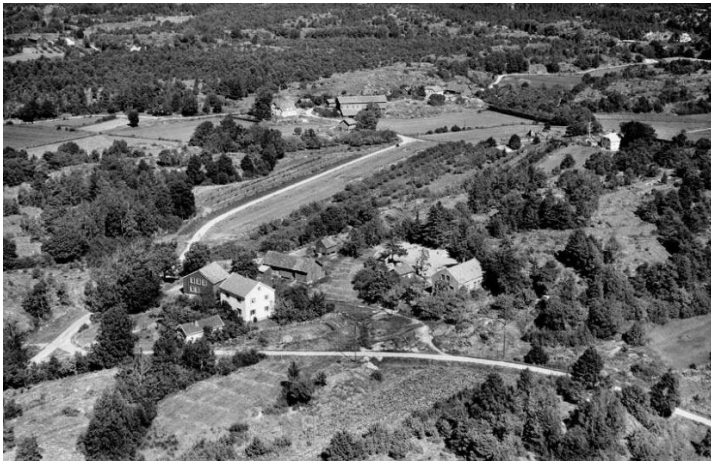
Brekke rundt 1957

På møtet i herredsstyret den 13. desember 1848 ble opprettelsen av faste skolen på Brekke endelig vedtatt. Dermed var en del av prestenkesetet formelt overført til kommunen, og et nytt kapittel av Brekkes historie kunne starte.