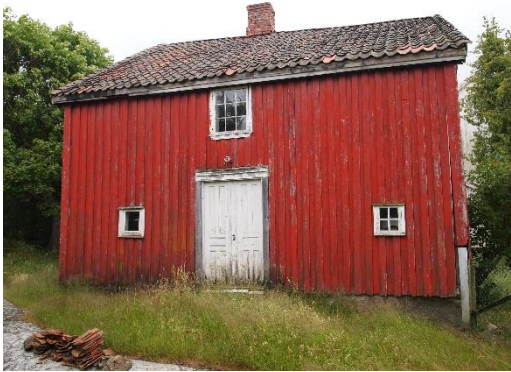
Gamle Brekke skole før restaureringsarbeidet startet i 2015

Skolestyrets plan for reparasjonene gikk ut på å det skulle være en stue på 7 x 7 alen, to kommer på 7 x 5 ½ alen og ett kjøkken på 6 ½ x 5 ¼ alen. Høyden i alle rom i første etasje skulle være 3 ½ alen. Dette er en innredning vi kjenner igjen fra dagens romløsning.