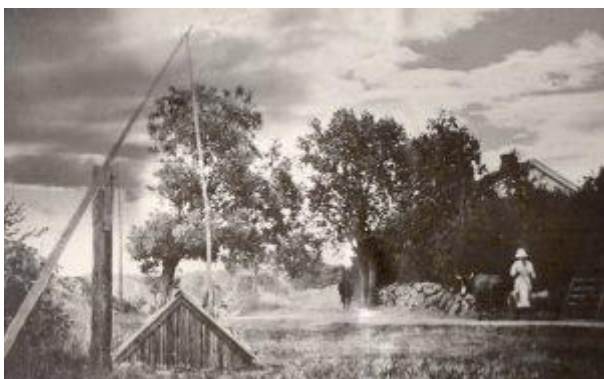
Første kjente bildet fra Brekke fra rundt 1880. Bildet er tatt mot nord. I forgrunnen ser vi brønnen som i dag ligger på andre siden av Svanekilveien.