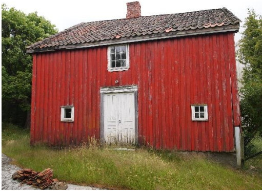
Gamle Brekke skole før restaureringsarbeidet startet i 2015

Skolestyrets plan for reparasjonene gikk ut på å det skulle være en stue på 7 x 7 alen, to kammer på 7 x 5 ½ alen og ett kjøkken på 6 ½ x 5 ¼ alen. Høyden i alle rom i første etasje skulle være 3 ½ alen. Dette er en innredning vi kjenner igjen fra dagens romløsning.