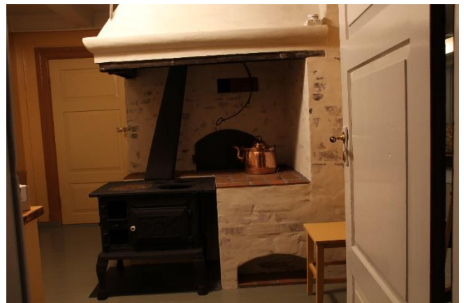
Grue på kjøkkenet i første etasje før og etter restaurering.