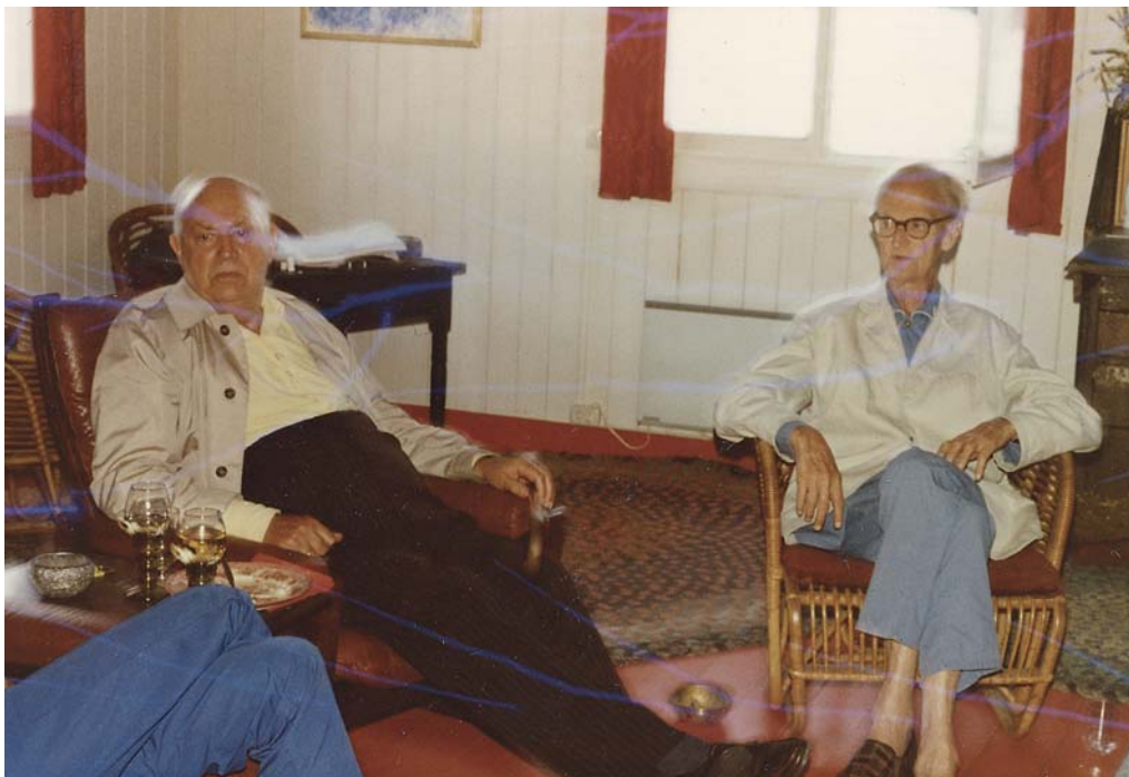
Kunstsamleren og forfatteren Rolf Stenersen på besøk i den store stua i 1. etasje på Knatten.

Hans andre sterke tilknytning til Fredrikstad var NRK. Det eldste båndet vi har funnet i NRK i Gamlebyen er et kåseri for Danmarks Radio. Det er fra 1966, og må ha blitt spilt inn i studio ute på Øra. Samme år flyttet NRK inn i et par rom i Tøihusgaten, der NRK