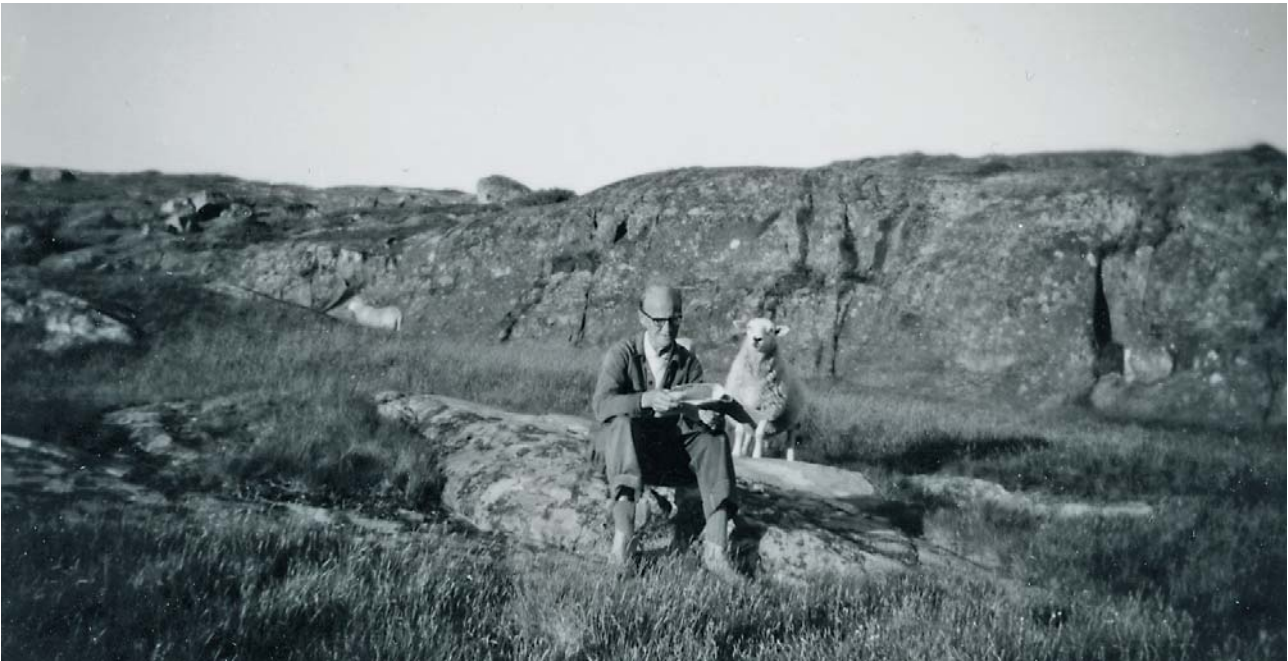
Forfatteren sammen med nysgjerrig sau på Akerøya på Hvaler, der familien tilbrakte mange ferier, og der den berømte romanen Lillelord ble fullført i 1955.